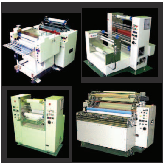
■既設装置に改造組込することも可能です。

クリーニングロールで吸着した塵埃をそのままにしておくと、製品上に脱落して再汚染する恐れがあります。クリーニングテープを使って二段転写することで、再汚染を回避します。クリーニングテープ〔セロピーCL〕は易剥離タイプなので、塵埃が飽和した時点で、装置を停めることなく容易に一周剥くことができます。