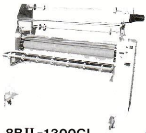
8BII-1300GL 1250mm巾までOK スプリング加圧の 普及型

この度、ラミネート一つ一つのノウハウの蓄積を「ガラス・建材」に向け、各種専用ラミネーター機を作成致しました。その用途は多方面に広がり、新時代の多種多様なニーズに応えることと信じております。ガラスへの貼り合せ（ラミネート）は、当社におまかせ下さい。