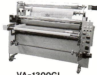
VA-1300GL 8BII-1300GLの上級機 ワンタッチエアシリンダー 加圧機